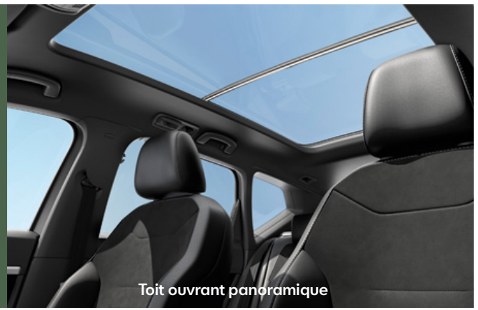
Toit ouvrant panoramique