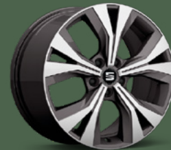
Jantes alliage 18" Performance Machined