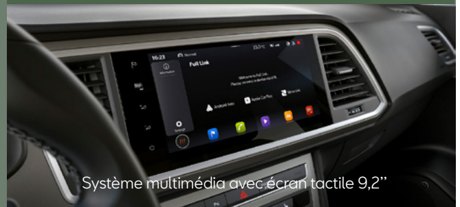
Système multimédia avec écran tactile 9,2"