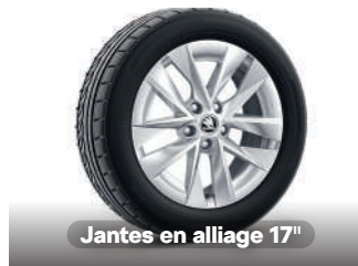
Jantes en alliage 17"