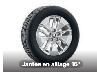
Jantes en alliage 16"