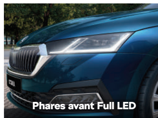
Phares avant Full LED