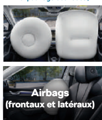
Airbags (frontaux et latéraux)

1 : Anti-patinage des roues / 2 : Régulation du couple moteur / 3 : Freinage multi-collisions