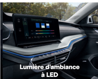
Lumière d'ambiance à LED