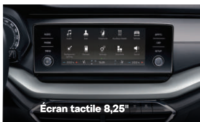
Écran tactile 8,25"