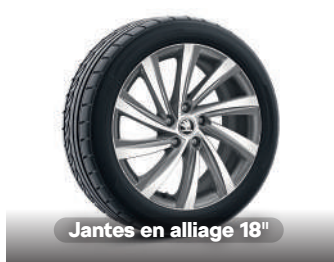
Jantes en alliage 18"