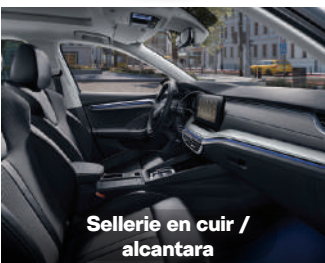
Sellerie en cuir / alcantara