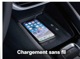
Chargement sans fil